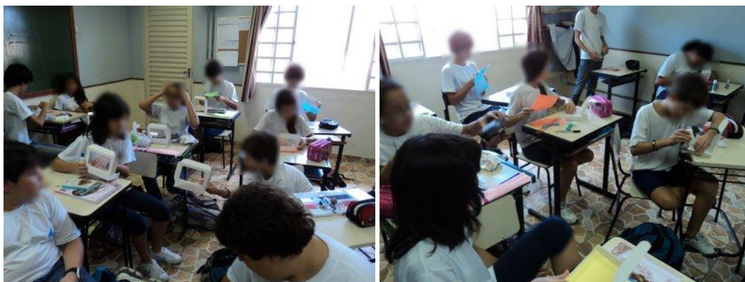
Imagens 4 e 5. Alunos da turma da manhã, trabalhando na construção de seus relicários. OBS. A identidade dos alunos foi preservada por meio de recurso gráfico de embaçamento proposital de seus rostos.