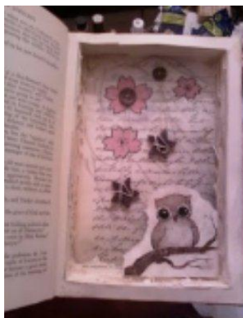
Imagem 3. Lindsay Heath cria relicários dentro de livros antigos. Recortando as páginas internas, ela cria "caixas" onde organiza objetos diversos, em composições minimalistas.

Gravura em metal, costurada e montada com alfinetes em caixa de acrílico.