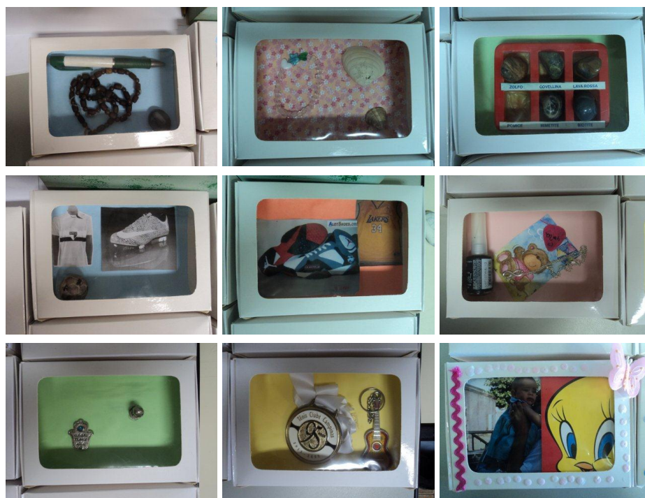
Imagens 6, 7, 8, 8, 10, 11, 12, 13 e 14. Relicários dos alunos, contendo seus objetos selecionados. Interessante notar a variedade de objetos, a grande maioria relacionada ao dia-a-dia dos alunos, como esportes, fotos de família e lembranças de viagens.