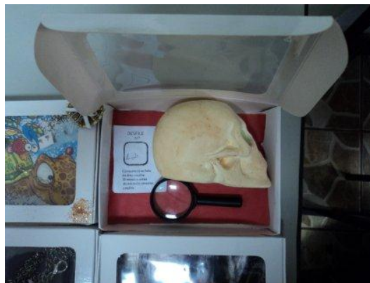
Imagem 33. Interessante destacar este relicário onde o objeto “não cabe” dentro dos limites propostos. Porém a justificativa do aluno era de que o escolheu, mesmo não cabendo, por ser um objeto ‘muitíssimo especial’ em sua vida, por ter sido dado para ele pelo avô. Nas semanas anteriores ao trabalho este aluno havia perdido o avô, que havia falecido, estando num momento emocional delicado. Sua escolha também foi respeitada, por acreditarmos que o momento emocional do aluno era significativamente mais importante do que o atendimento de uma norma técnica, como ‘caber na caixinha’.

Imagens 21, 22, 23, 24, 25, 26, 27, 28, 29, 30, 31 e 32. Relicários dos alunos, contendo seus objetos selecionados. Interessante notar a variedade de objetos, a grande maioria relacionada ao dia-a-dia dos alunos, como esportes, lembranças de viagens, alguns brinquedos e objetos como as palhetas do aluno autor do relicário da imagem 21, que, estudante de praticante de guitarra, declarou que a música “é a minha vida”.