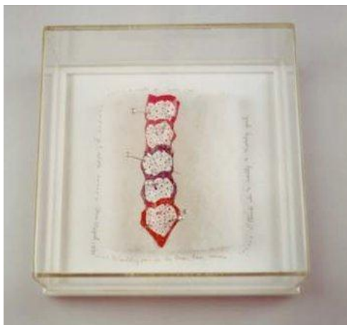
Imagem 2. Ana Miguel - Je t'adore, 1990.