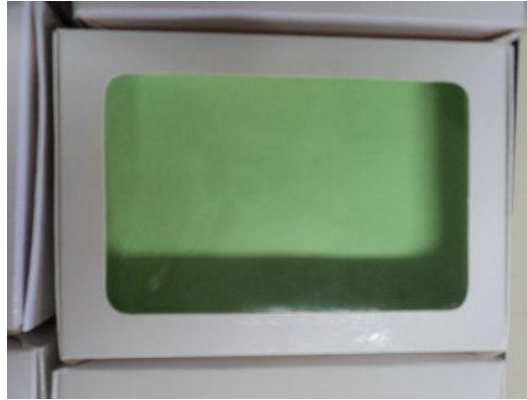
Imagem 15. Interessante destacar este relicário, onde não há nenhum objeto dentro. O aluno declarou que não tinha nenhum objeto que desejasse preservar num relicário. O destaque é feito por ser este aluno um dos alunos de inclusão, que apresenta problemas psicológicos (autismo) com sérias dificuldades de expressar sentimentos. Sua opção foi respeitada e seu relicário foi mantido vazio, junto aos outros, no momento expositivo.