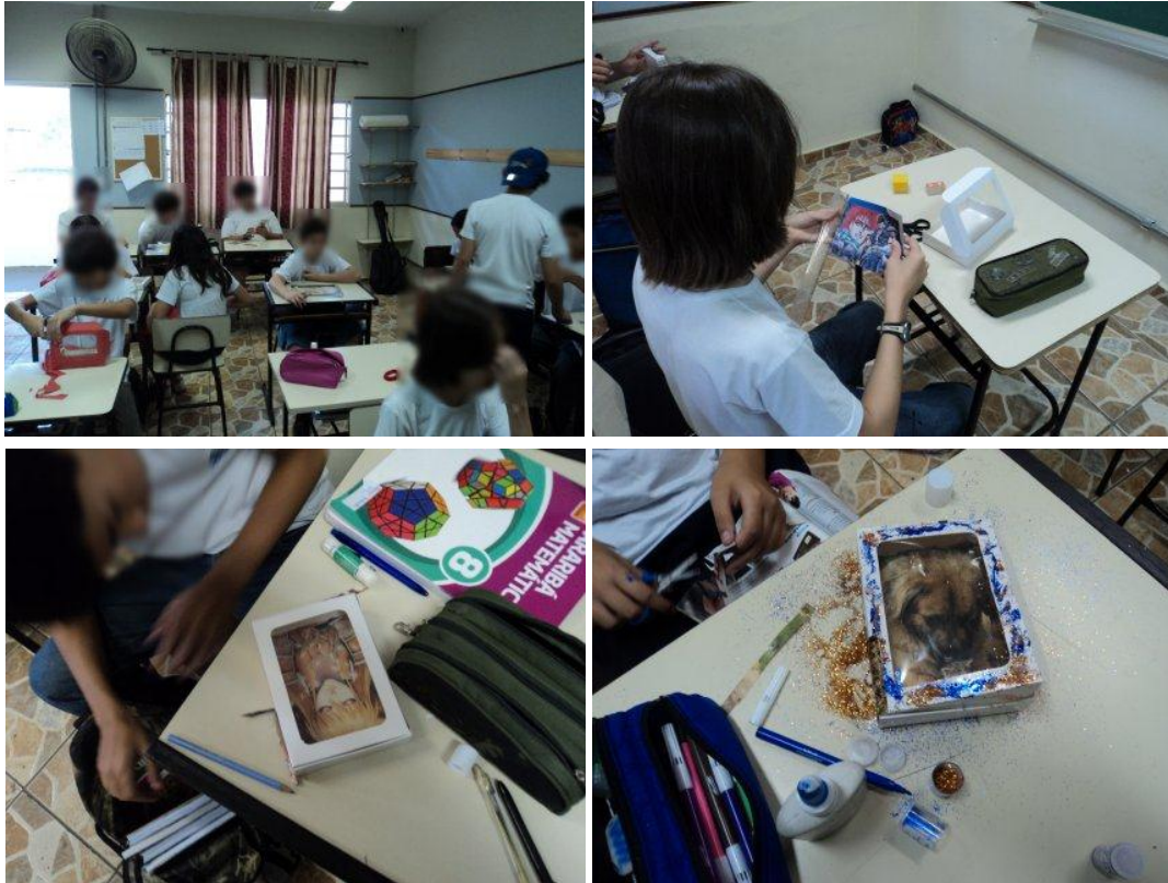
Imagens 17, 18, 19 e 20. Alunos da turma da tarde, trabalhando na construção de seus relicários. OBS. A identidade dos alunos foi preservada por meio de recurso gráfico de embaçamento proposital de seus rostos.