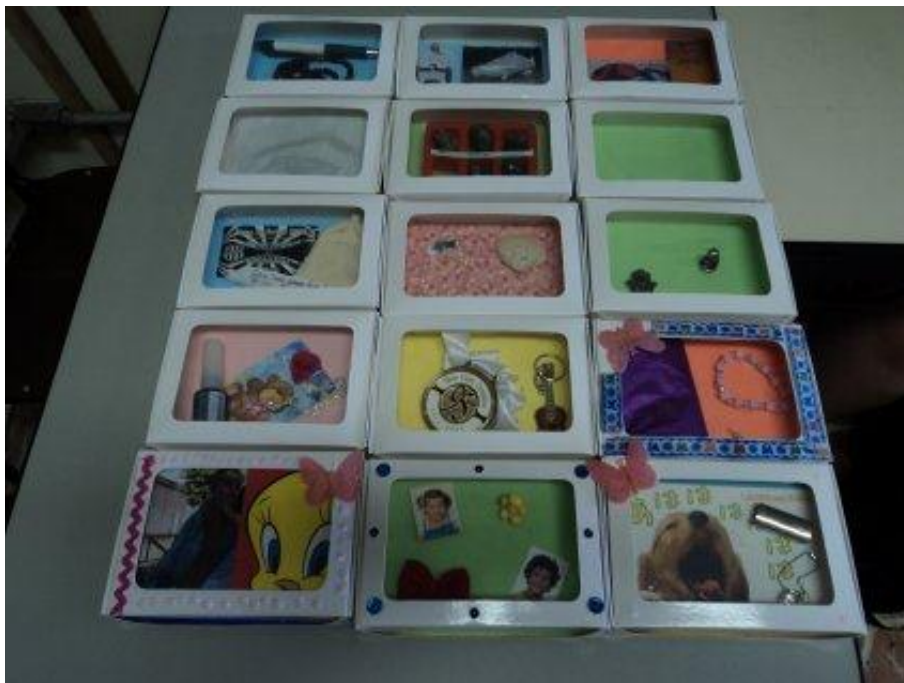
Imagem 16. Os relicários prontos, em momento expositivo, quando os alunos chamaram os colegas de outras turmas para ver seus trabalhos.

Os resultados alcançados nesta etapa, com esta turma, foram extremamente ricos! Ao exibirem seus relicários aos colegas de turma, e também das outras turmas, os alunos demonstraram orgulho de seus trabalhos, em especial de seus objetos, relatando os motivos de escolha, explicando e localizando, no tempo e espaço, as razões da sua seleção.